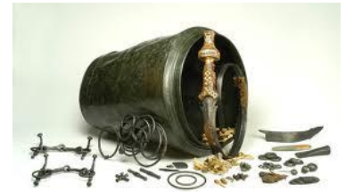
De inhoud van het graf

Van Oudheusden begon met te vertellen, dat de lange en bewogen geschiedenis van wat nu Noord-Brabant is, veel sporen heeft nagelaten. In het landschap, in monumenten, in voorwerpen, in documenten. En natuurlijk ook in de geschiedenis van mensen.