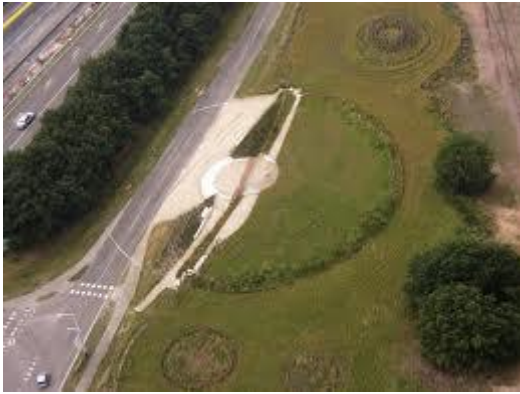
Een luchtfoto van het Vorstengraf

Brabants erfgoed. Veel heeft hij daarover al beschreven in zijn boek 'Verhalen van Brabant'. En daar zou hij ons vanavond over gaan vertellen. We waren benieuwd.