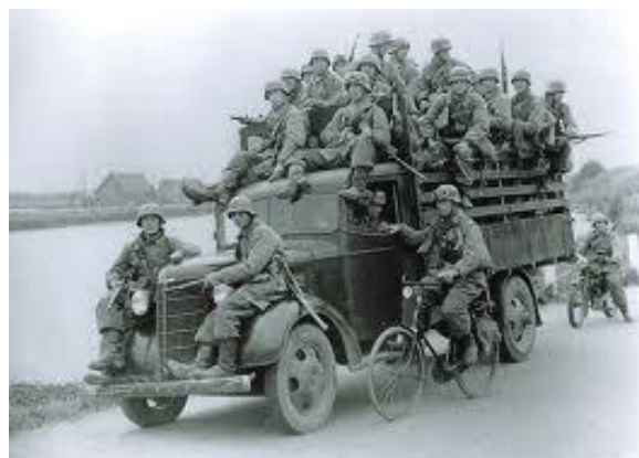
Terugtrekkende Duitse soldaten. "Dat is mijn fiets", hoorde ik iemand zacht tegen zijn buurman zeggen.

4 september viel Antwerpen in geallieerde handen. De plannen waren om snel op te rukken en via Arnhem het Ruhrgebied in te nemen. Begrijpelijke plannen omdat er tus-