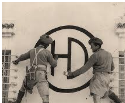
Het symbool 'HD' werd door de Schotten langs de veroverde wegen geplaatst. Naast 'Highland Division' kreeg dit de betekenis 'Highway Decorators'.