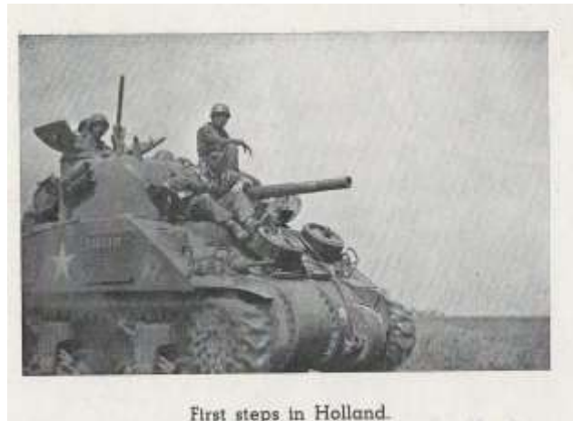
First steps in Holland.