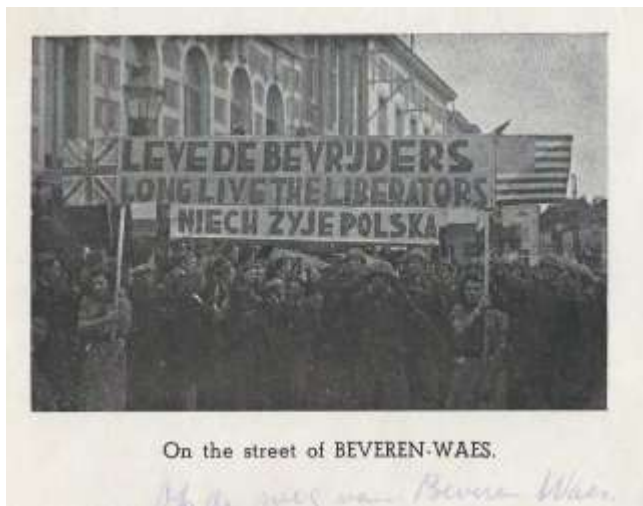
On the street of BEVEREN-WAES.