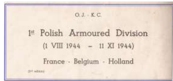
Voorkant van het boekje en de eerste bladzijde