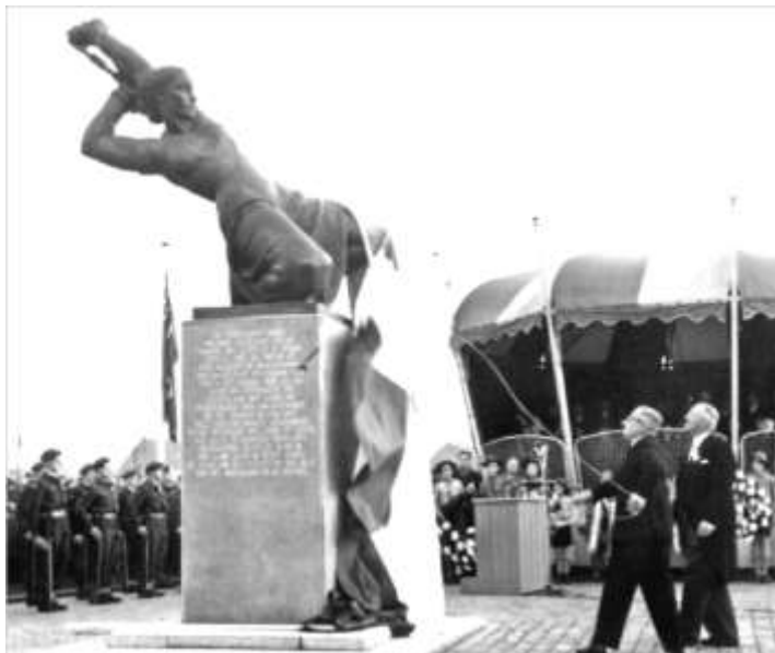
Commissaris van de Koningin Jan de Quay onthult hier het Jan de Rooij monument aan de Tilburgseweg in Sprang.

tie van prins Bernhard als bevelhebber van de Binnenlandse Strijdkrachten. Hoe denkt Jan de Quay, die op 24 maart 1945 tot minister van Oorlog wordt benoemd eventuele constitutionele gevaren te voorkomen?