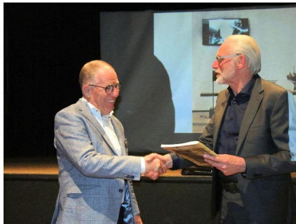
De inspirator krijgt het eerste exemplaar overhandigd.