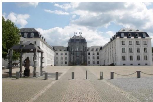
Saarbrücken, historisch museum

Hij is op Curaçao geboren en groeit op in een welgestelde Joodse familie. Tien jaar oud verhuist hij naar Nederland. In 1934 begint hij een studie rechten in Leiden. In de meidagen van 1940 is Maduro als 2 e luitenant verantwoordelijk voor de verdediging van Villa Leeuwenburg in Leidschendam. Hij weet de villa succesvol te verdedigen en de opmars van de Duitsers te vertragen. Na de capitulatie komt Maduro als krijgsgevangene in het Oranjehotel terecht. Na een half jaar laten de Duitsers hem vrij.